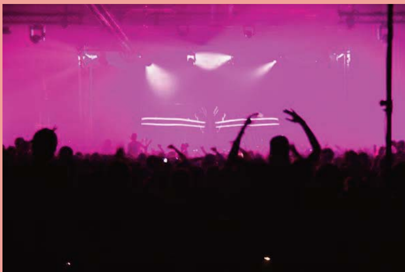
VITALIC EN CONCERT AU WRONG BAR