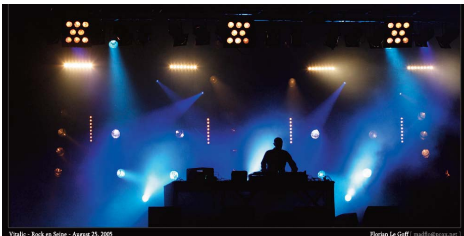
Vitalic - Rock en Seine - August 25, 2005

Suite au succès du Poney EP , Vitalic est sollicité pour sortir un album. Mais il prend son temps, réalisant plusieurs commandes de remix, et se consacrant au live,